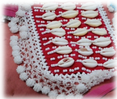
Şekil 1 Nazara Karşı Kullanılan Deniz Kabuğu Örneği

Bu obje diğer Yörük guruplarının el sanatları içinde görülmesine rağmen, kayda değer çalışmalara az rastlanmaktadır. Burada denizden olukça uzak dağlarda yaşayan bir kültürel grubun deniz kabuğunu hangi maksatla kullandığı