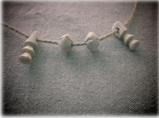
Şekil 7. Nazara Karşı Kullanılan Çaltı Boncuk Örneği6