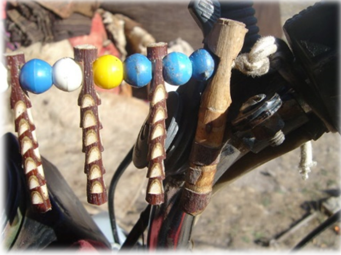
Şekil 3. Nazara Karşı Kullanılan Çaltı Boncuk Örneği2