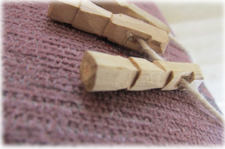
Şekil 5. Nazara Karşı Kullanılan Çaltı Boncuğu Örneği4