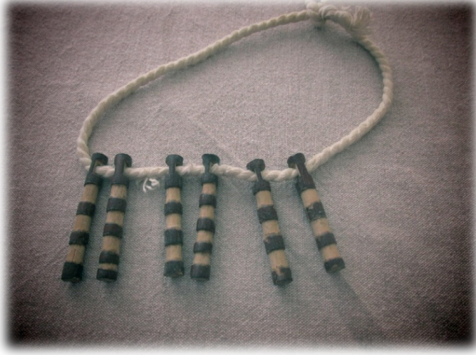
Şekil 2. Nazara Karşı Kullanılan Çaltı Boncuk Örneği1

yaşamını deneyimlemiş kişiler halen söz etmekte ve kullanımına devam etmektedir. Bu uygulamanın halen Sarıkeçili Yörükler arasındaki kullanımına dair Horzumlu'nun saha çalışmasında bahsettiği üzere; bebek başta olmak üzere, çadırda, çuval kenarlarında, kaymak makinasının üzerinde, motorsiklet veya traktörde hatta süt bidonunda bile çaltı ağacından küçük tahta parçaları görülebildiği belirtilmektedir (2014:214). Çaltı boncuğun nasıl, kimler tarafından hazırlandığı ve takıldığıyla ilgili olarak; bunun çoban işi olarak adlandırıldığı belirtilmektedir. Bir ticari amaç güdülmeden nesilden nesile öğrenilerek yapılıp dağıtıldığı belirtilmiştir. Bu uygulama için “çaltıyı ufacık ufacık bıçakla erkekler ederdi, dizerdi, biz de dakaridik çocuklara” belirtmektedir şeklinde (Elif Çoban,83, 05.07.2016).