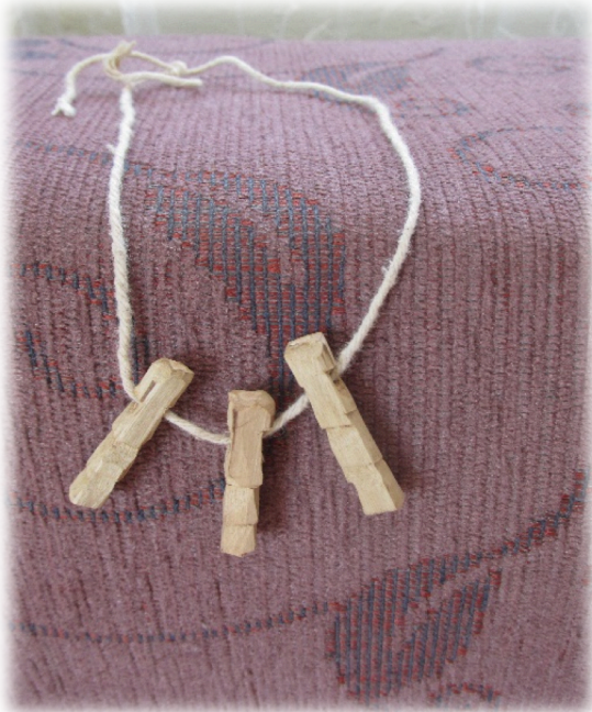
Şekil 4. Nazara Karşı Kullanılan Çaltı Boncuğu Örneği3